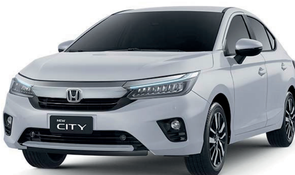
BRANCO TOPÁZIO PEROLIZADO