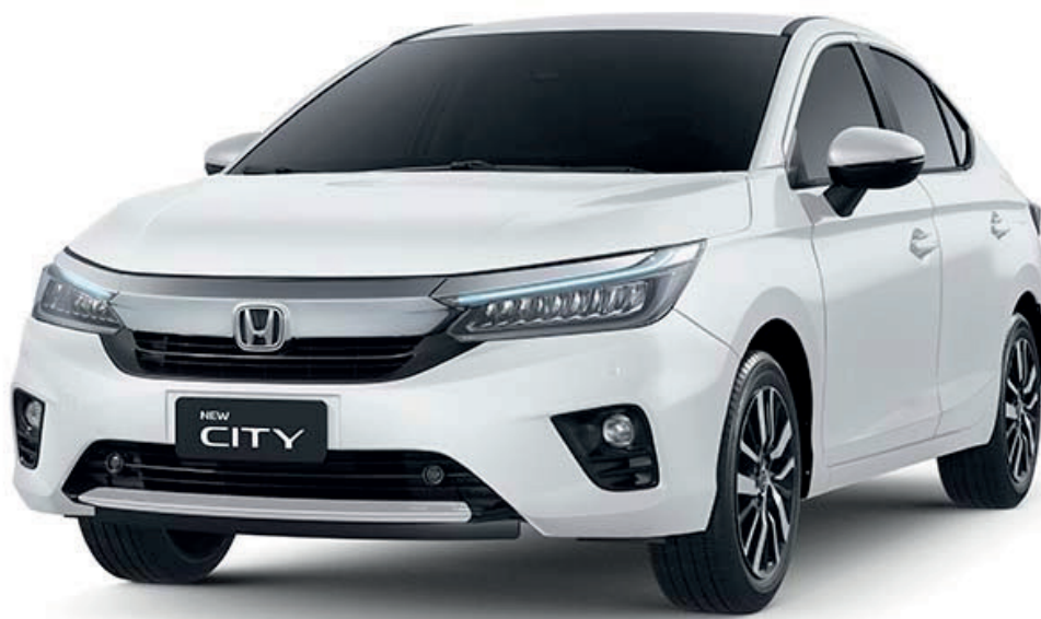
BRANCO TAFETÁ SÓLIDO