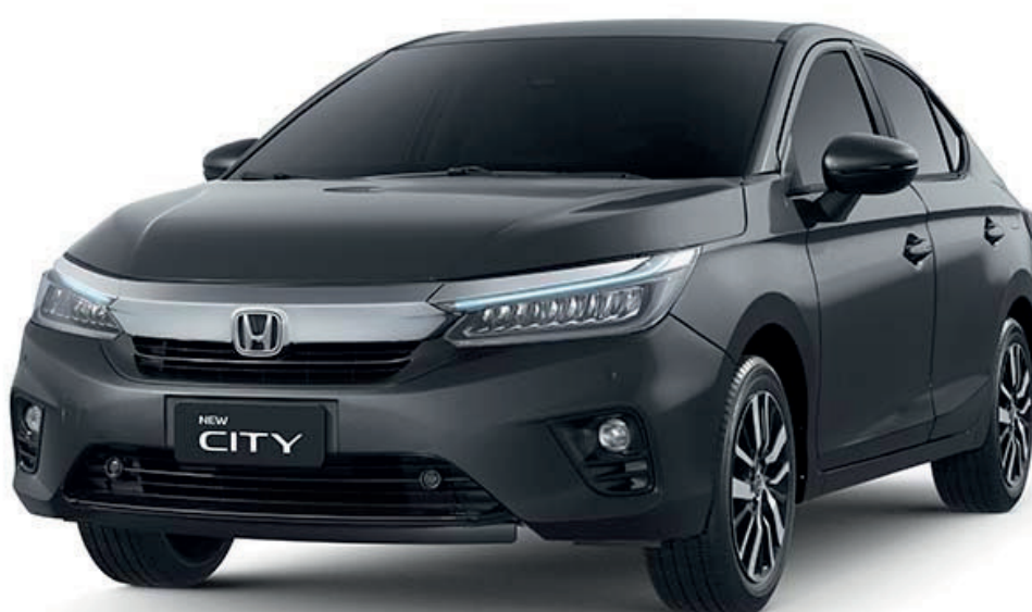
CINZA BARIUM METÁLICO