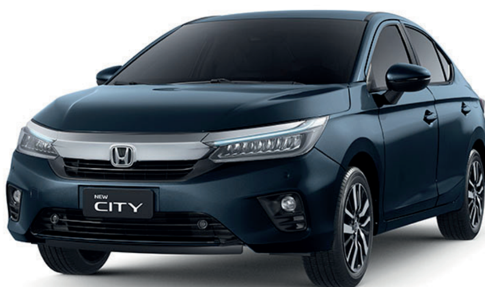
AZUL CÓSMICO METÁLICO