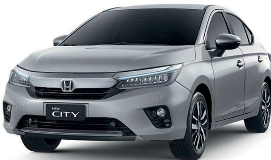
PRATA PLATINUM METÁLICO