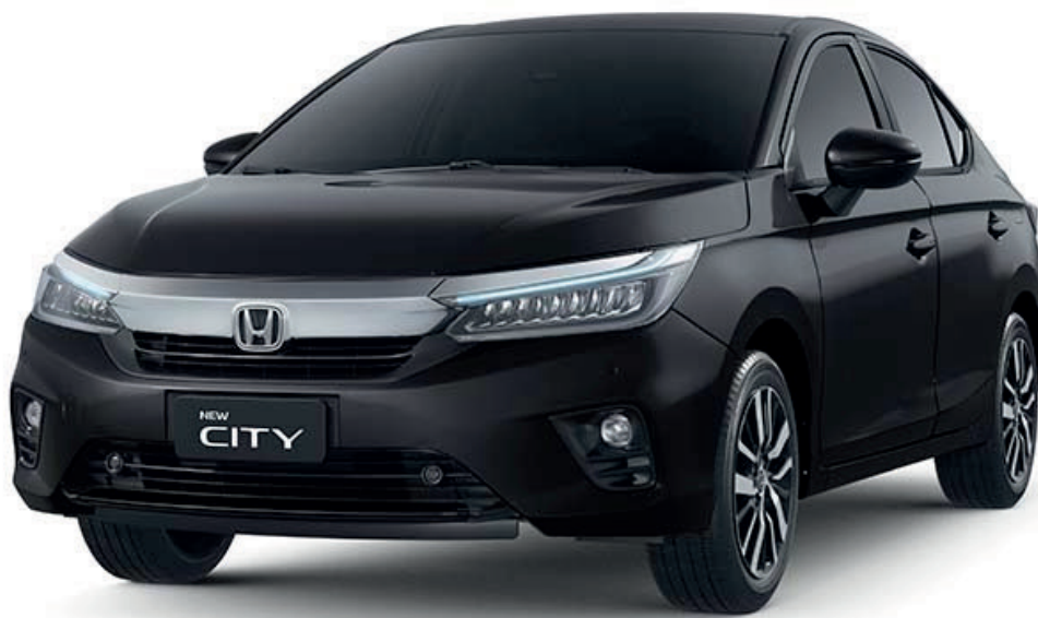
PRETO CRISTAL PEROLIZADO